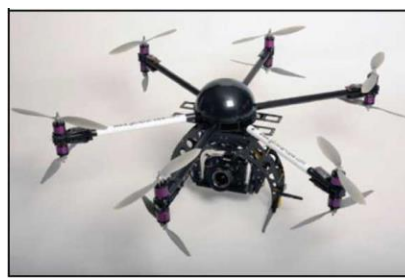
Вертолетного типа (многомоторные)